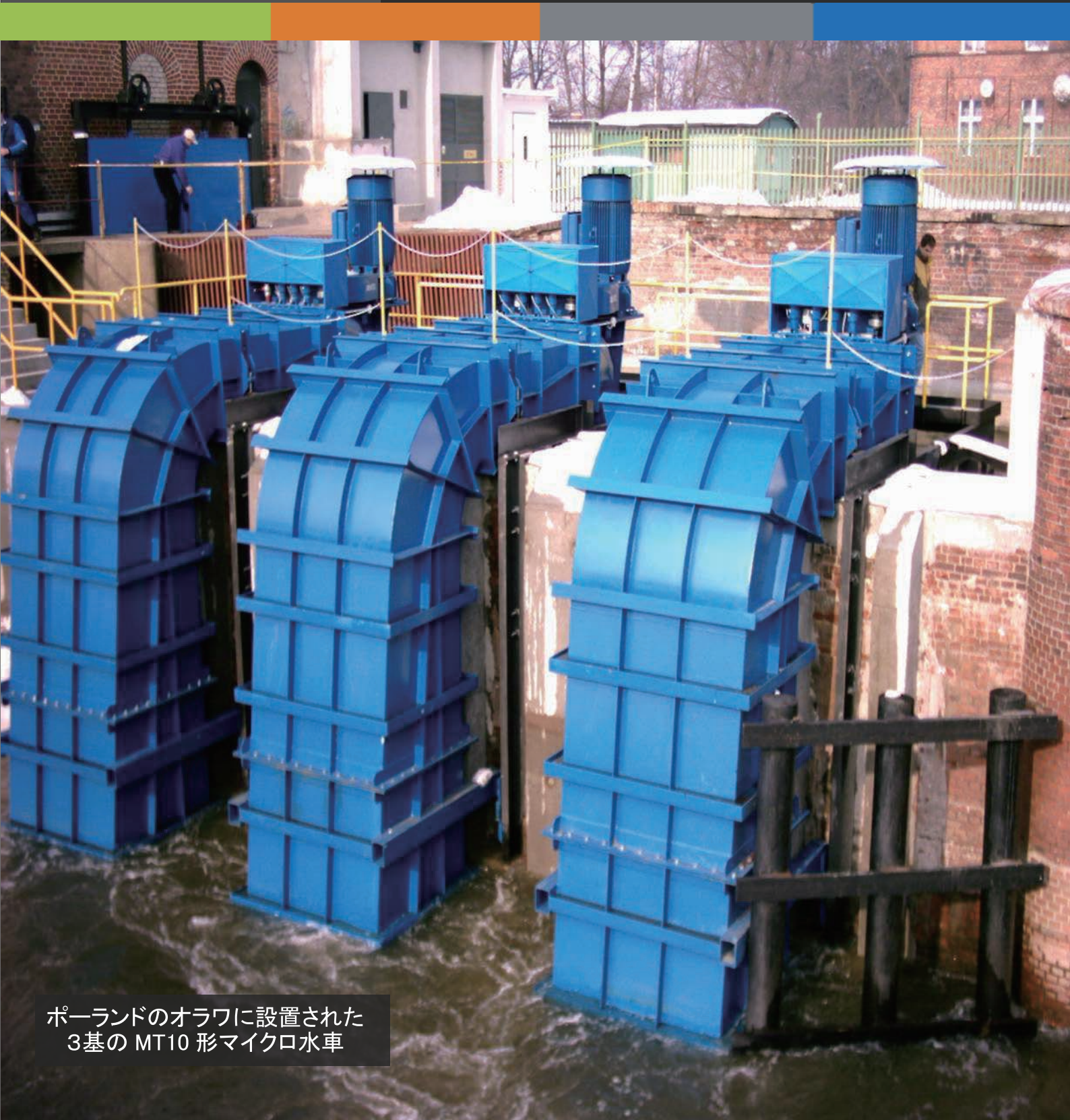
ポーランドのオラワに設置された 3基の MT10 形マイクロ水車