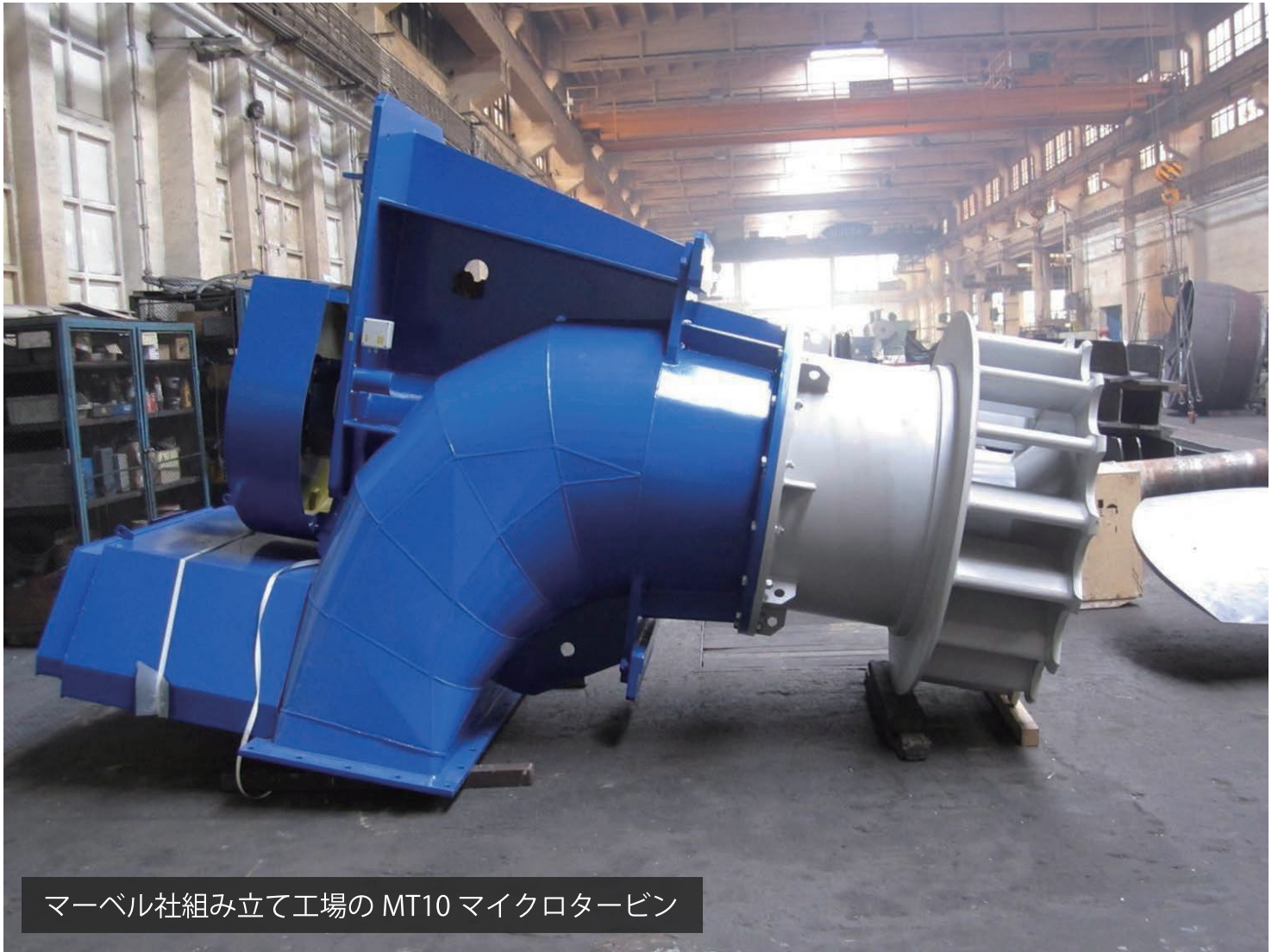
マーベル社組み立て工場の MT10 マイクロタービン

マーベル社の TM マイクロタービン【MT3、MT5、MT10】は、サイフォン水車で、自然に流れる水から 180kW もの電力を生み出します。