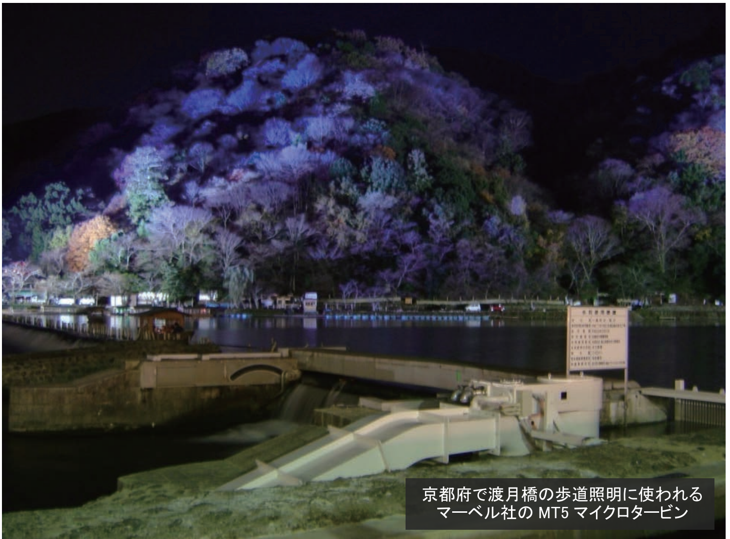
京都府で渡月橋の歩道照明に使われる マーベル社の MT5 マイクロタービン